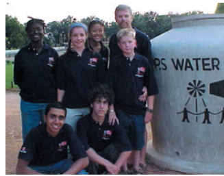
Atlantic Province Water Project

From that initial work, after 45 years of CPPS presence, we have the pastoral care of four big parishes in Dar Es Salaam, three in Manyoni and one in Dodoma. We built and administer a huge hospital in Itigi, several clinics, schools for trades and for academics, and two Seminaries for vocations to our Congregation. We have invited many Orders of Nuns to work in each parish. We are present in the social field and, in cooperation with the CPPS missionaries of the Atlantic Province, we promote the Water Project.