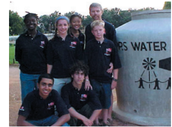
Progetto Acqua Provincia Atlantica

Da quel lavoro iniziale, dopo circa 45 anni di presenza CPPS curiamo 4 grandi parrocchie a Dar Es Salaam, 3 a Manyoni, 1 a Morogoro e 1 a Dodoma. Un grande Ospedale a Itigi, alcuni Centri Sanitari sul territorio, varie Scuole Superiori o di Arte e Mestieri, 2 Seminari per le vocazioni all'Istituto. Abbiamo invitati tanti Istituti di Religiose a collaborare in ogni Parrocchia. Siamo presenti nel campo sociale nell'offrire acqua ed energie per la gente, in cooperazione col Water Project, gestito dalla Provincia Atlantica dei Missionari CPPS.